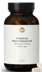
Большая доза витамин B5 (пантотеновая кислота)

https://cherrypick-life.ru/product/bolshaya-doza-vitamin-b5-pantotenovaya-kislota/